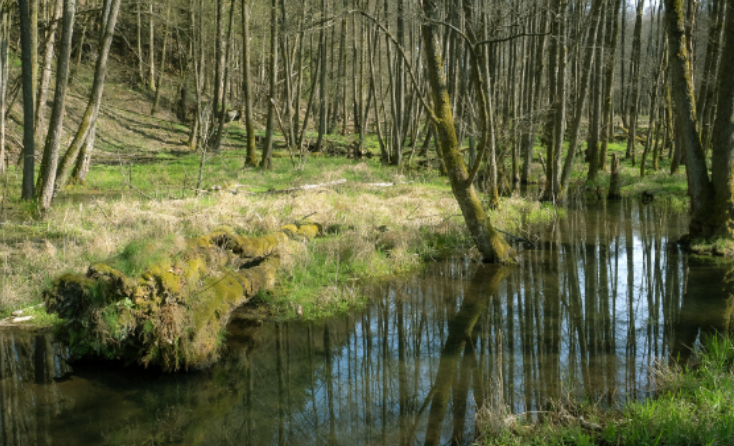
Auenlandschaft an der Sinn – Exkursion auf der Wassertagung - I. Queck