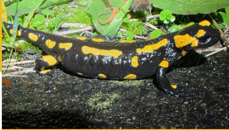
Feuersalamander haben es bei uns nicht leicht: Straßen als tödliche Falle - M. Hehn

2025 engagierten sich die Nachtschützer bei Infoständen, nahmen Kontakt zu Behörden auf und organisierten Nachtspaziergänge. Gut besucht war die Nachtfalterführung im Anschluss an die Nacht der Poesie Mitte August auf der Trimburg. In 2026 wollen wir noch stärker auf die Lichtverschmutzung im Landkreis aufmerksam machen und mit guten Impulsen zu insektenfreundlicher Beleuchtung der Umwelt beitragen. In Zusammenarbeit mit Kitas, Schulen, Gartenbauvereinen und SternenparkführerInnen wollen wir über verschiedenste Aktionen auf die Vielfalt der Nachtfalter und auf Missstände durch Lichtverschmutzung oder Flächenversiegelung aufmerksam machen und diese aber auch aktiv verbessern. Mit Nachtführungen, wie z.B. am 26.06. am Tintenfass beim Berghaus Rhön oder durch Schaffen von Nachtfaltergärten soll der Wert der Nacht erkannt und geschützt werden.