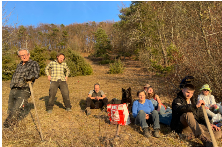
Arbeitseinsatz auf einer BN-Fläche, hier Tannenberg bei Windheim - E. Assmann