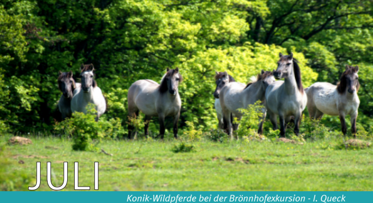
Konik-Wildpferde bei der Brönnhofexkursion - I. Queck