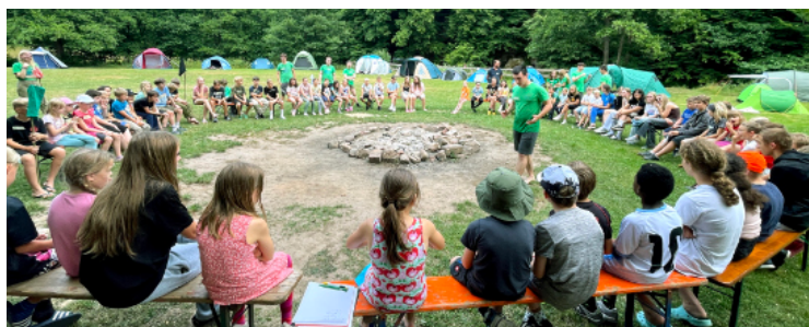
Zeltlager „Wildnis an der Schondra“ 2025 - E. Assmann