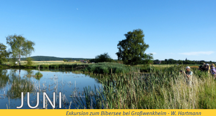
Exkursion zum Bibersee bei Großwenkheim - W. Hartmann