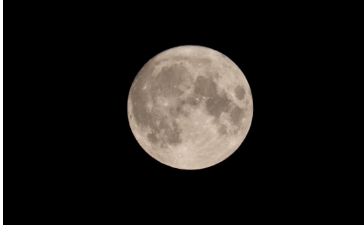
Vollmond - O. Jungklaus

Treffpunkt: an der historischen Umlenkstation am Tintenfass, ausgeschildert ab Parkplatz Berghaus Rhön