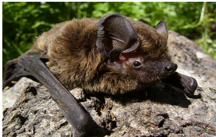
Kleiner Abendsegler, Fledermaus des Jahres 2026