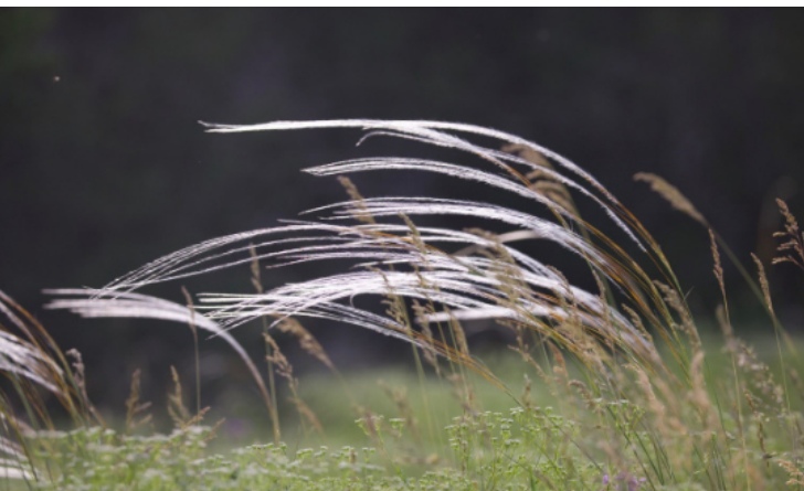
Federgras auf BN-Fläche, Pflanzengesellschaft des Jahres 2026 - O. Jungklaus