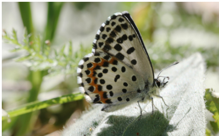
Fetthennenbläuling - O. Jungklaus