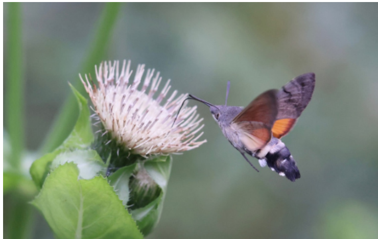
Taubenschwänzchen - O. Jungklaus