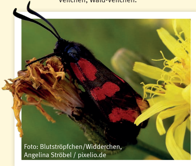
Blutströpfchen/Widderchen

Hufeisenklee, Kratz- und Kohldistel, Bunte Kronwicke, Wiesen-Labkraut, Echtes Labkraut, Nachtviole, Pfefferminze, Roßminze, Einjähriges Silberblatt, Wilde Möhre, Raus Veilchen, Wald-Veilchen.