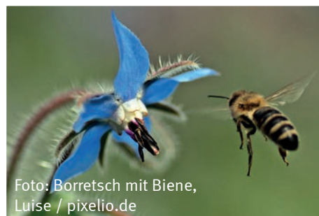
Borretsch mit Biene

Der Borretsch lockt nicht nur zahllose Hummeln und Wildbienen an, seine Blätter sind darüber hinaus die Leibspeise der Raupen