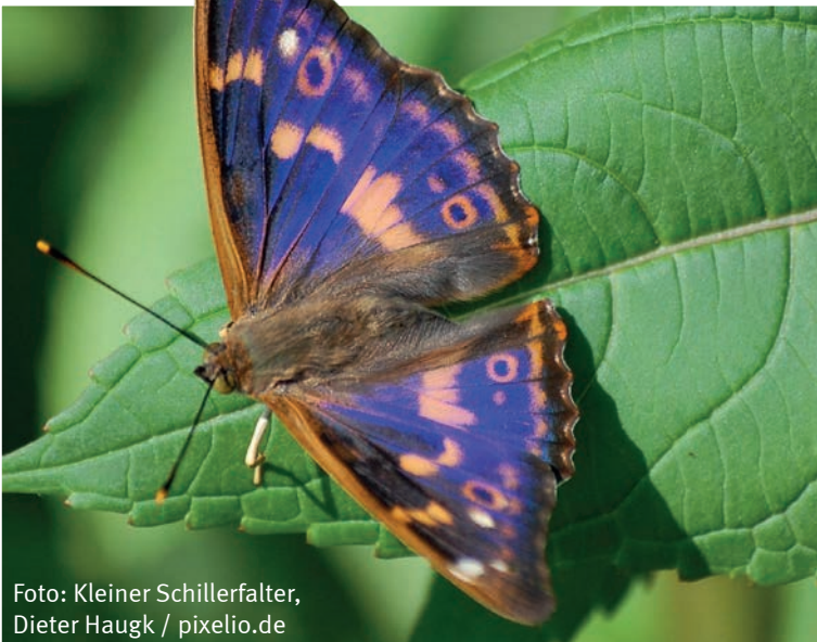
Foto: Kleiner Schillerfalter

Auch die zeitig blühende Salweide ist ebenso erste Nektarquelle nach kalten Wintern wie sie zahlreichen Raupen seltener und prachtvoller Schmetterlingsarten als Futterpflanze dient, etwa der Raupe des Schillerfalters.