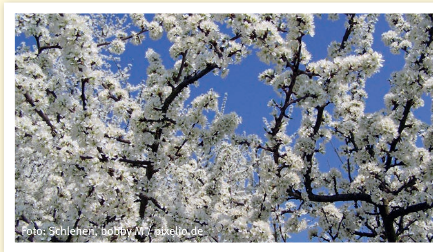
Foto: Schlehen

Die Schlehe ist ein wertvolles Vogelschutzgehölz und dient zahlreichen Falterraupen als Futterpflanze. Im zeitigen Frühjahr sind die Schlehenblüten eine wichtige Nektar-