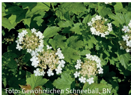
Foto: Gewöhnlichen Schneeball

Von absolut überragender ökologischer Bedeutung (wenngleich nicht originär heimisch) ist auch der Sommerflieder, dessen rosa- bis lilafarbene Blütentrauben von hiesigen Schmetterlingsarten gerne besucht werden, etwa vom Tagpfauenauge oder dem Kleinen Fuchs. Besonders die Sorte Buddleja Davidii „Pink Delight“ oder „Black Knight“ üben auf Schmetterlinge, Schwebfliegen und Hummeln eine magnetische Anziehung aus.