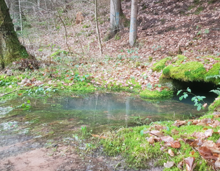
Quelle Schondratal & Molche an Teichen im Neuwirtshauser Forst - E. Assmann