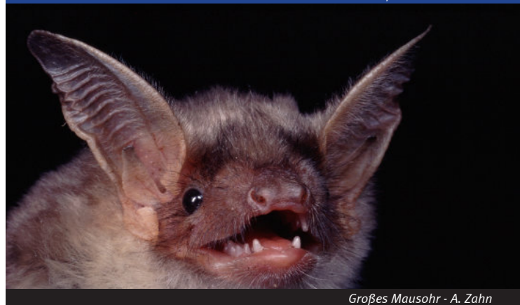
Großes Mausohr - A. Zahn