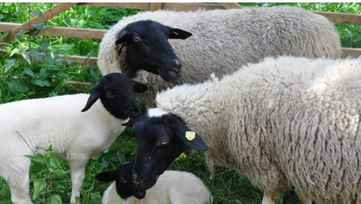
Rhönschafe - F. Mährlein

Anmeldung über BN-Büro; bei Interesse Fahrgemeinschaft