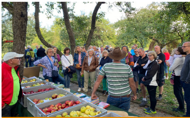
Apfel-Kürbisfest - F. Probeck