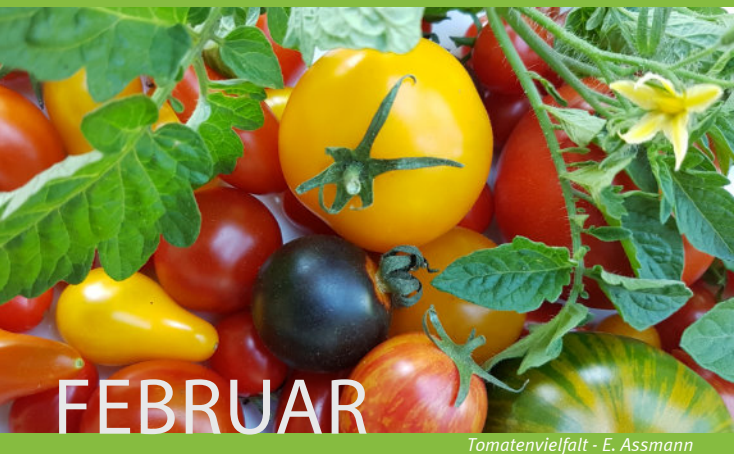
Tomatenvielfalt - E. Assmann